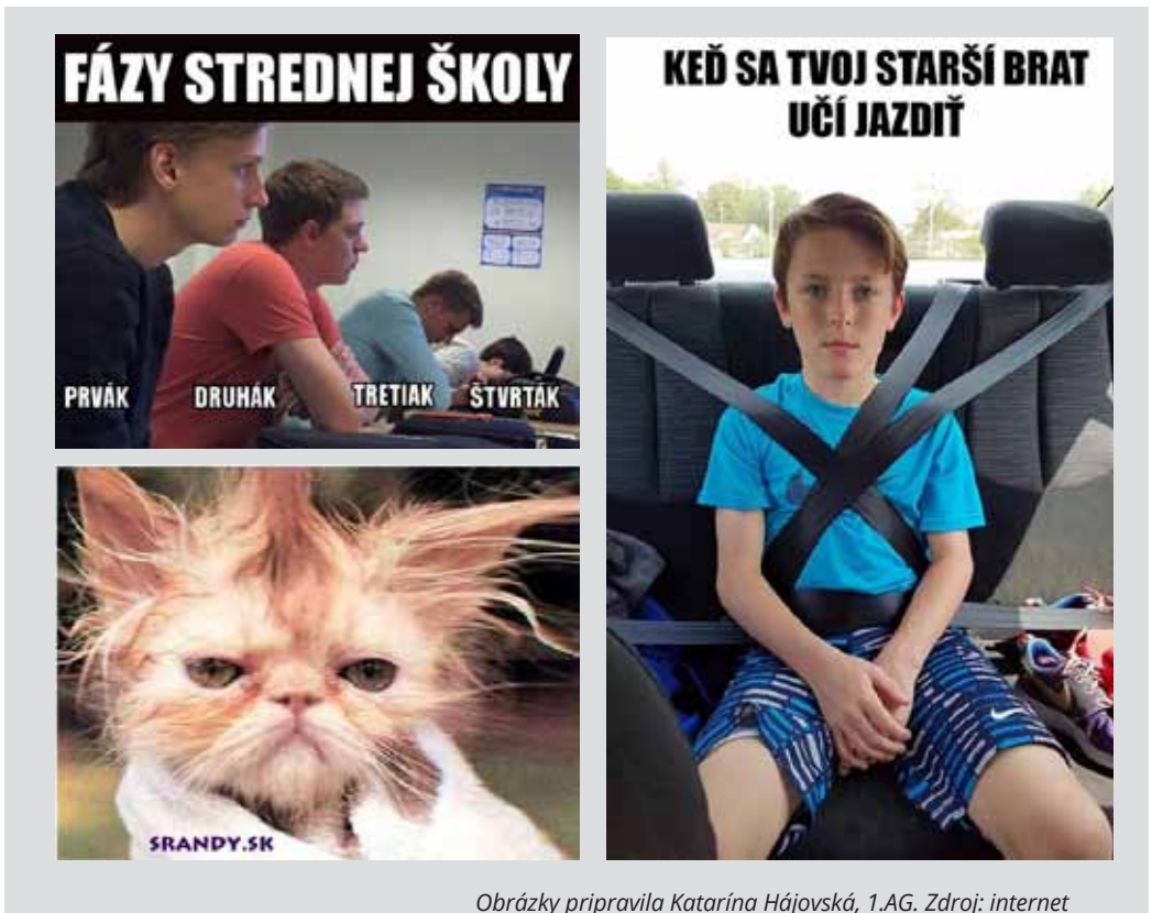
Obrázky pripravila Katarína Hájovská, 1.AG.